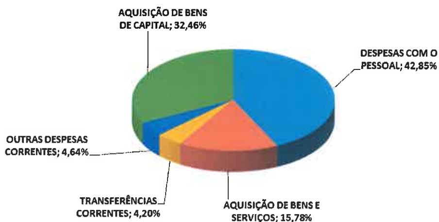
Despesas Previstas Ano 2018